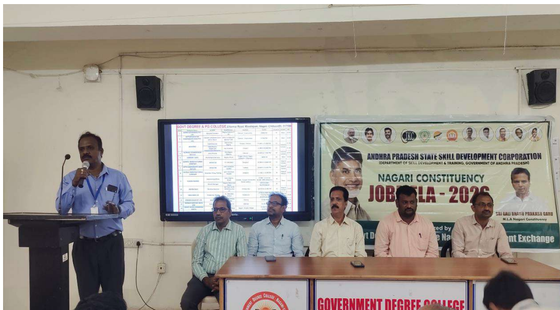
HR representatives from participating companies presenting their company profiles and job roles to the Job Aspirants