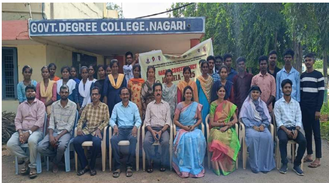
Selected Candidates with Principal, Vice Principal, APSSDC Representatives and JKC Team