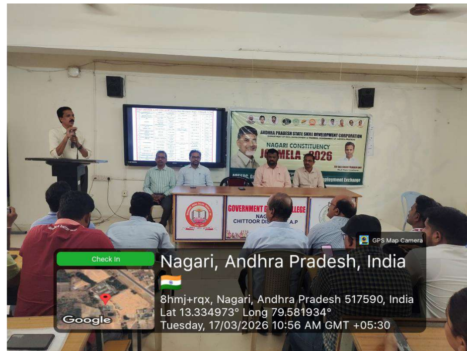
The Principal delivering his inaugural speech, advising students to focus on acquiring skills, gaining experience, and building a strong foundation for future career growth.