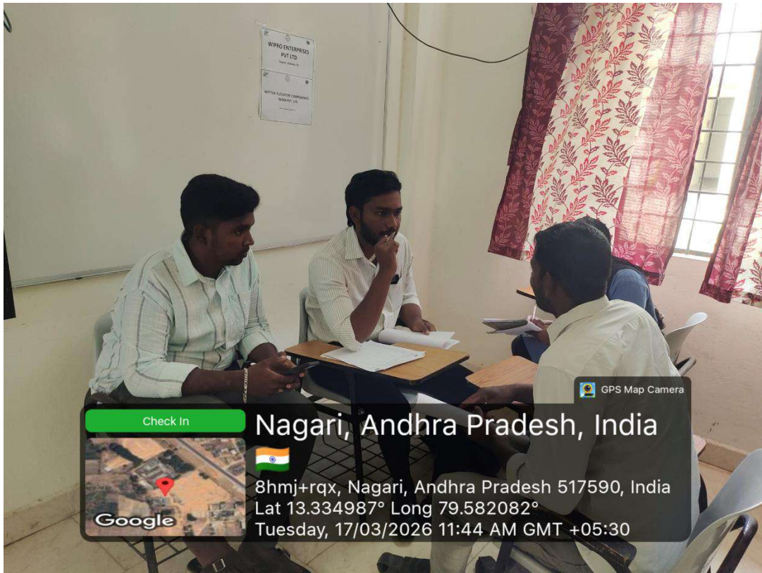
During Interview Process