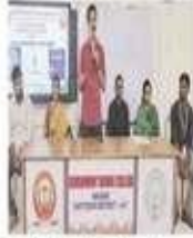
విదేశీ ప్రాంతాలలో విద్యనభ్యసించే అవకాశం ఉంది. విదేశీ ప్రాంతాలలో విద్యనభ్యసించే అవకాశం ఉంది.

పతి సహజ విద్యార్థులలో అంతర్జాతీయ ఇంటర్ షిప్ ద్వారా కళాశాలలో నాలుగు గోడల పక్క విద్యనభ్యసించే విద్యార్థులకు ప్రత్యక్ష అనుభవం పొందటానికి సరి ప్రత్యక్ష షిప్ కళాశాల ప్రస్తుతం కార్యక్రమం చేపట్టింది. కళాశాలలో కేంద్ర గైడ్ల ద్వారా, చక్కని, సత్కార్యక్రమాలను నిర్వహించి విద్యార్థులకు అవగాహన కల్పించే ప్రయత్నం చేస్తుంది. ఈ కార్యక్రమంలో విద్యార్థులు విదేశీ ప్రాంతాలకు వెళ్లి అభ్యసించే అవకాశం ఉంది. విదేశీ ప్రాంతాలలో విద్యనభ్యసించే అవకాశం ఉంది. విదేశీ ప్రాంతాలలో విద్యనభ్యసించే అవకాశం ఉంది.