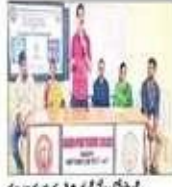
విదేశీ ప్రాంతాలలో విద్యనభ్యసించే అవకాశం ఉంది. విదేశీ ప్రాంతాలలో విద్యనభ్యసించే అవకాశం ఉంది.

పతి సహజ విద్యార్థులలో అంతర్జాతీయ ఇంటర్ షిప్ ద్వారా కళాశాలలో ప్రత్యక్ష అనుభవం పొందటానికి సరి ప్రత్యక్ష షిప్ కళాశాల ప్రస్తుతం కార్యక్రమం చేపట్టింది. కళాశాలలో కేంద్ర గైడ్ల ద్వారా, చక్కని, సత్కార్యక్రమాలను నిర్వహించి విద్యార్థులకు అవగాహన కల్పించే ప్రయత్నం చేస్తుంది. ఈ కార్యక్రమంలో విద్యార్థులు విదేశీ ప్రాంతాలకు వెళ్లి అభ్యసించే అవకాశం ఉంది. విదేశీ ప్రాంతాలలో విద్యనభ్యసించే అవకాశం ఉంది.