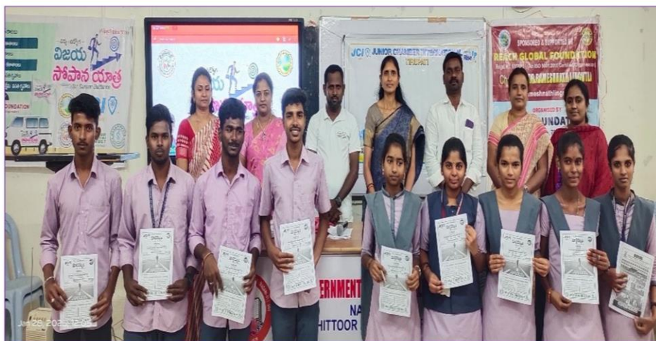
Students with the Handouts of the career planning strategies provided by the Way Foundation