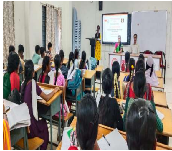
Students giving feedback on the programme