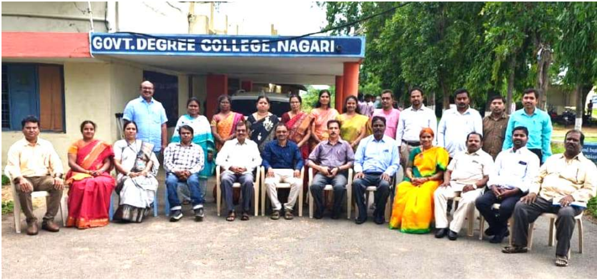
Principal and Staff Group Photograph with University Nominees and other members