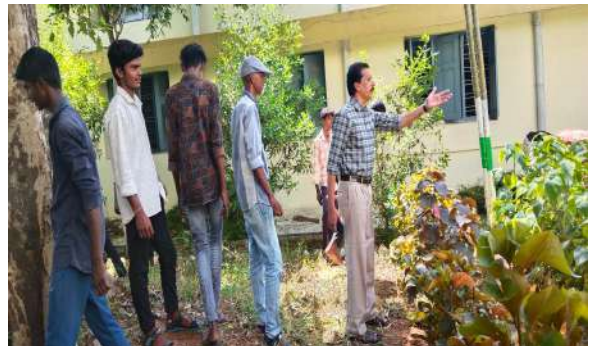
Principal monitoring the gardening work of the students