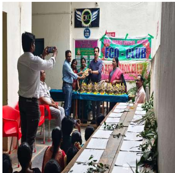
Distribution of Eco-Friendly idols to the staff