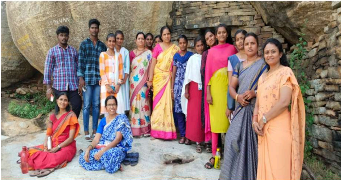
GDC (A) Nagari - Field trip to Pandurajapuram caves and Bheemunipaadham on 28-9-2024