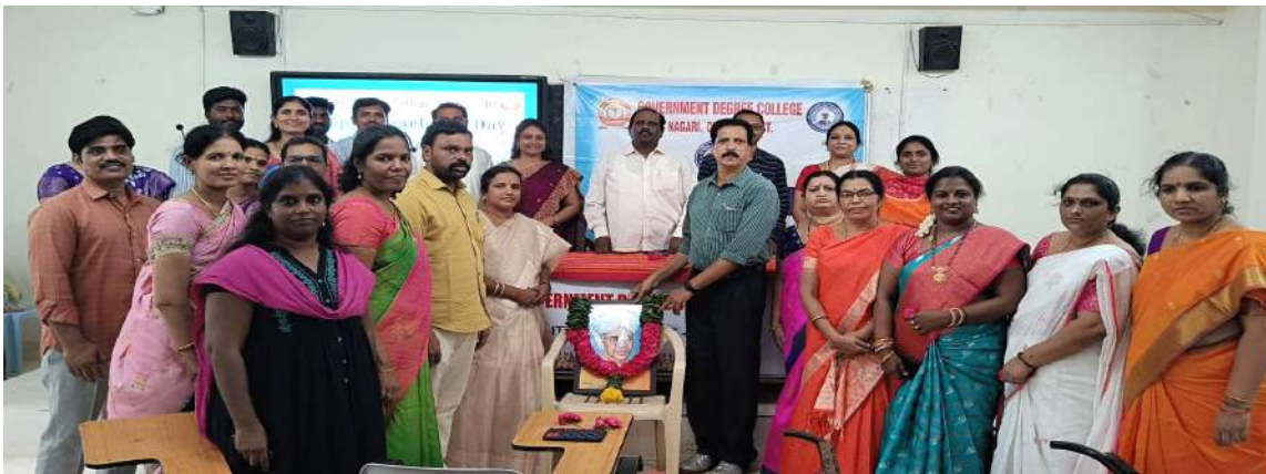
Principal and Staff inaugurating the celebrations