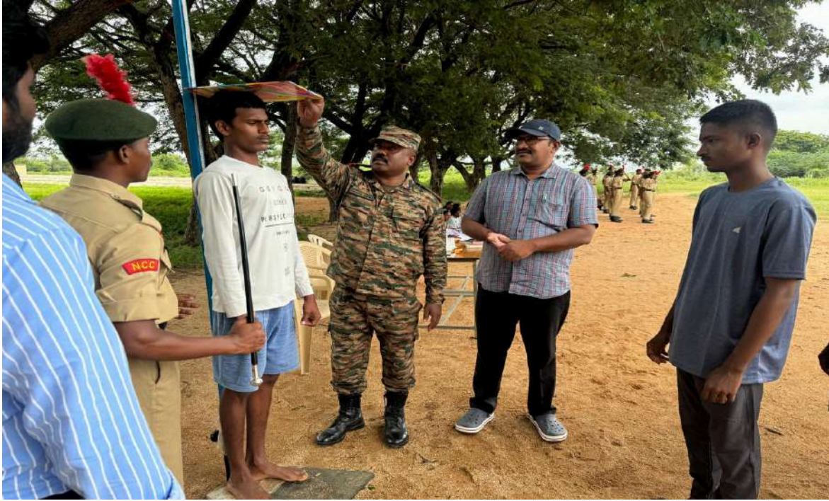
During the selection process